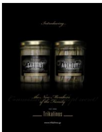
Τrikalinos Γαύρος & Σαρδέλα Φιλέτο Ελληνικά φιλέτα ψαριών, μαριναρισμένα στα καλύτερα υλικά.