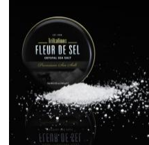
Τrikalinos Αφρίνα Ανθός Αλατιού