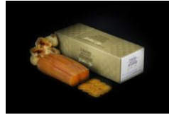
Τrikalinos Μελίγλωρο Αυγοτάραχο Περιορισμένης κυκλοφορίας Ελληνικό Αυγοτάραχο