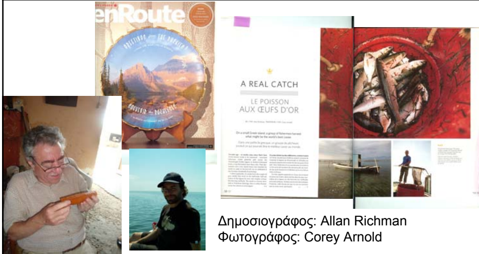
Δημοσιογράφος: Allan Richman

EST. 1928 Trikalinos GREY MULLET BOTTARGA