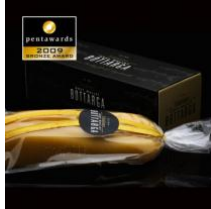
Τrikalinos Αυγοτάραχο Αφυδατωμένο & τριμμένο Ελληνικό Αυγοτάραχο Ανώτατης Ποιότητας Ελληνικό Αυγοτάραχο